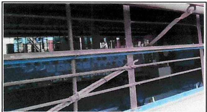
Foto 4: Tambien es necesario que protejan del agua en los dias lluviosos pues se tiene que movilizar a los niños con su mobiliario hacia un rincón del aula para que no se mojen mientras está lloviendo.