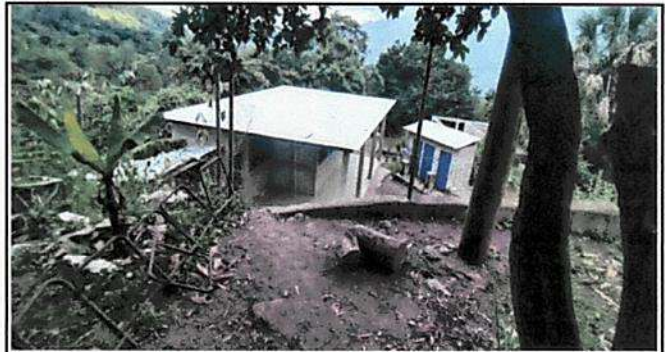
Foto 2: Ya no se cuenta con seguridad en todo el inmueble del establecimiento por existe facilidad de ingreso para animales y personas sin escrupulos