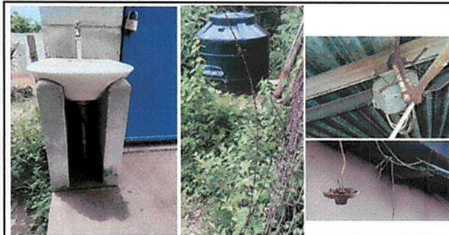
Foto 5: Los lavamanos tienen dañado el de drenaje y el grifo de salida, se requiere el mejoramiento al sistema eléctrico para el aula, corredor y bodega, mas un tinaco, el tinaco que existe era pequeño y esta roto.