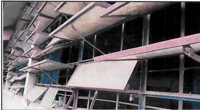
Foto 3: Las ventanas son necesarias para proteger el ingreso de animales que destruyen los utiles escolares y material didáctico almacenado en el aula y bodega