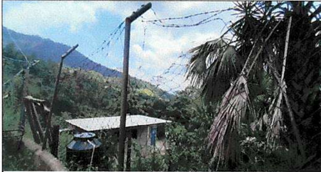
Foto 1: Es necesaria el remozamiento de la circulación con malla en los setenta y cinco metros.